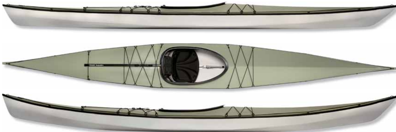
T-1600, gerade gespannt für maximale Geschwindigkeit